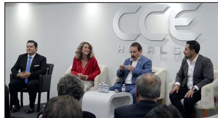
▲ Se reunieron con empresarios para presentar sus propuestas de campaña.