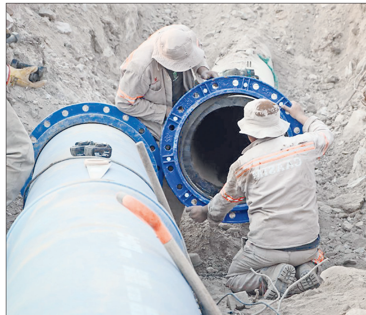
▲ Fueron sustituidos mil 455.50 metros de tubería de 24 pulgadas de diámetro, correspondiente al tramo comprendido entre los salones Macros y el tanque Abundio Martínez en Mineral de la Reforma.

De manera simultánea, cuadrillas de Caasim realizaron labores para el mantenimiento (lavado e impermeabilización) de dos tanques de almacenamiento de agua potable, situados en el mismo punto, los cuales contaban con al menos 8 años sin atención, cuando lo