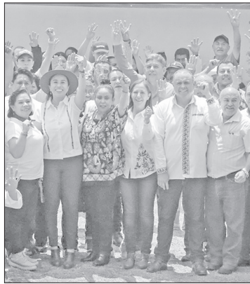
▲ De gira en Atotonilco el Grande, llamaron a buscar la unidad ante la próxima jornada electoral del 2 de junio.