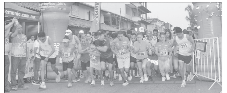
▲ Las actividades fueron parte de las celebraciones en honor a la gesta heroica del Capitán Antonio Reyes Cabrera.

Las celebraciones continuarán el lunes 20 de mayo con ceremonias cívicas en honor a la heroica hazaña de "El Tordo". A las 4:30 pm se encenderá el fuego simbólico en La Peña de los Franceses, en el poblado de Tehuetlán. La antorcha recorrerá desde ese lugar hasta Huejutla, visitando los cuatro barrios tradicionales y culminando en el centro de la ciudad, donde se encenderá el pebetero junto al monumento dedicado a Reyes Cabrera.