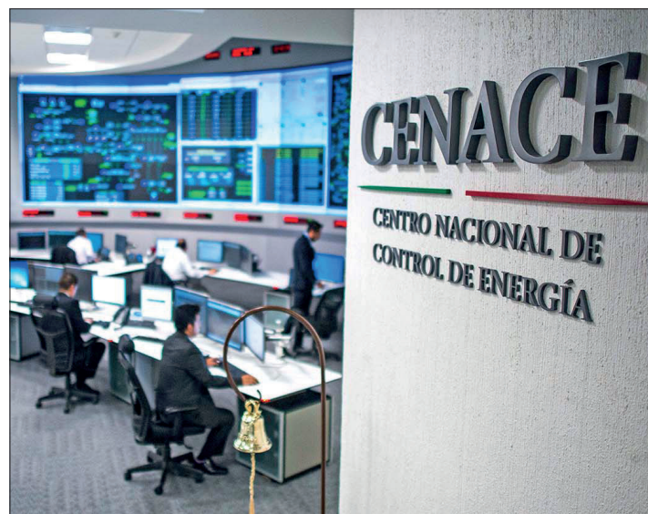
▲ Cuando se presentan estas situaciones, el Cenace se encarga de hacer un balance en el sistema.

Una alerta es una medida preventiva que indica posibles riesgos operativos que surgen en el día a día durante la operación del sistema eléctrico nacional, el cual está compuesto por cuatro sistemas, uno de ellos es el