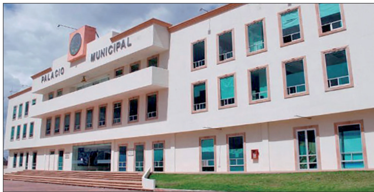
▲ La encargada de la bodega electoral trabaja en la Secretaría de Fomento Económico, en el ayuntamiento de Tulancingo.

Consideran que se podría prestar a manipulación de la información