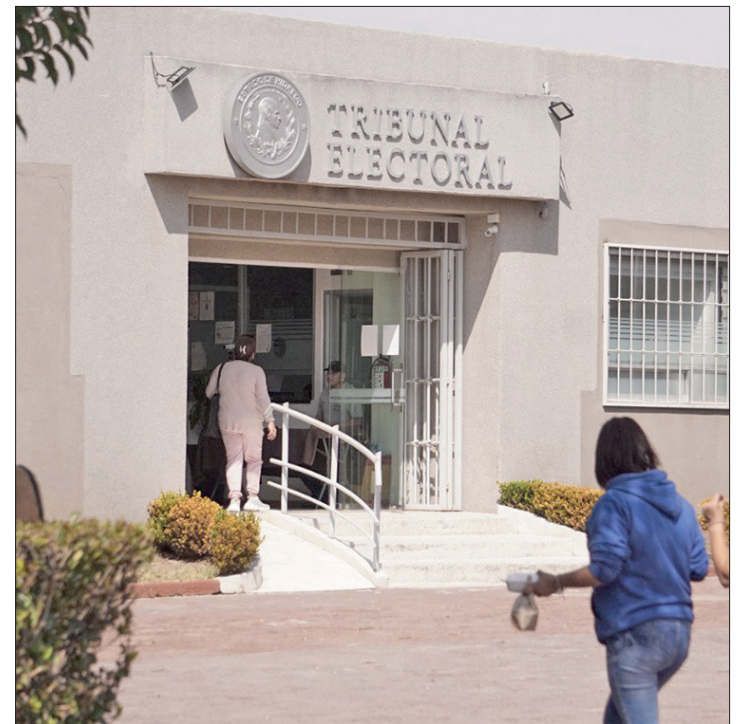
▲ El Tribunal Electoral local debió definir a quién iba dirigida la multa.

Sin embargo, no se demostró haber cumplido con lo ordenado dentro del plazo establecido.