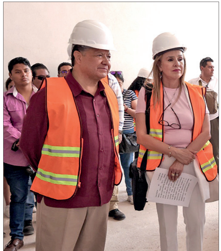
▲ El gobernador estuvo de gira ayer en la Feria de la Salud en Actopan y supervisión de infraestructura hospitalaria.

También recientemente las y los candidatos del Partido Acción Nacional (PAN) en Hidalgo denunciaron ante medios de comunicación que han recibido amenazas y daño a los vehículos que utilizan en campaña.