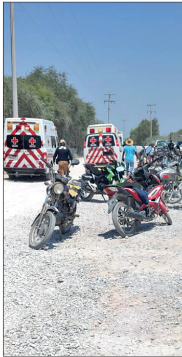
▲ Se enfrentaron pobladores de Pueblo Nuevo y Puerto Bangandho.

Pobladores de Pueblo Nuevo y Puerto Bangandho, Ixmiquilpan, se enfrentaron la mañana del sábado dejando como saldo 10 personas lesionadas, una de ellas trasladada al Hospital Regional del Valle del Mezquital.