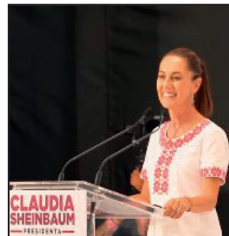
▲ Sheinbaum Pardo destacó la relevancia de las mujeres en la economía. Desde Pánuco, Veracruz, Xóchitl Gálvez urgió a construir un "gran acuerdo" opositor para tirar a Morena. Jorge Álvarez Máynez visitó una universidad privada de Xalapa.

Sheinbaum también delineó varias propuestas para el "segundo piso de la transformación", incluyendo un aumento del salario mínimo a 2.5 canastas básicas al final del sexenio, la planeación estratégica de inversiones, la consolidación de proyectos clave como el Tren Maya y la implementación de una