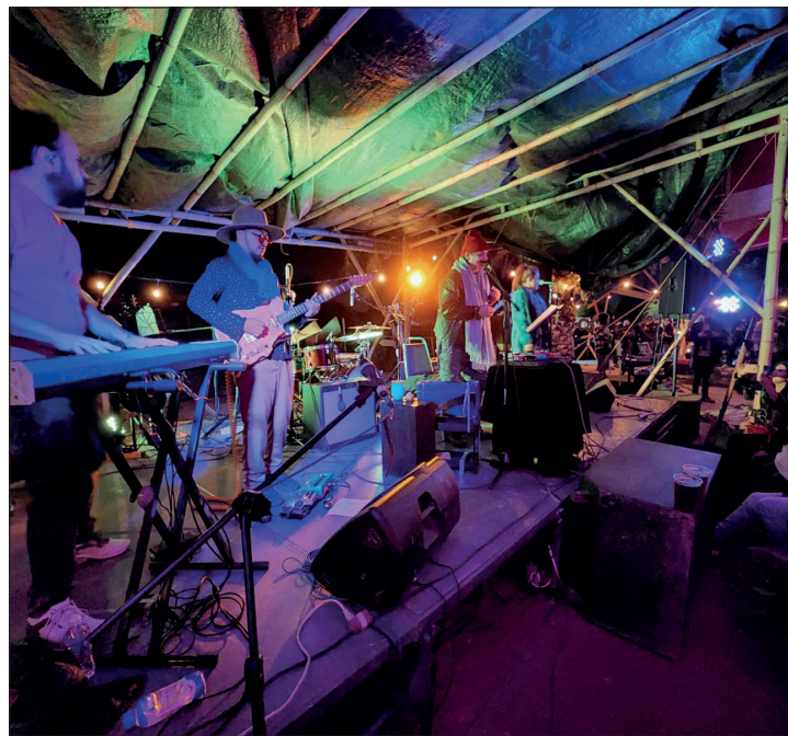
▲ Seguirán promoviendo entre el público de todas las edades sus canciones más representativas.

Ya anuncian los próximos eventos entre los que destaca Cráneo y Lasser con GXNZX se presentan el 18 de mayo con su Diablos Tour, así como Surfistas del Sistema el próximo 24 de mayo.