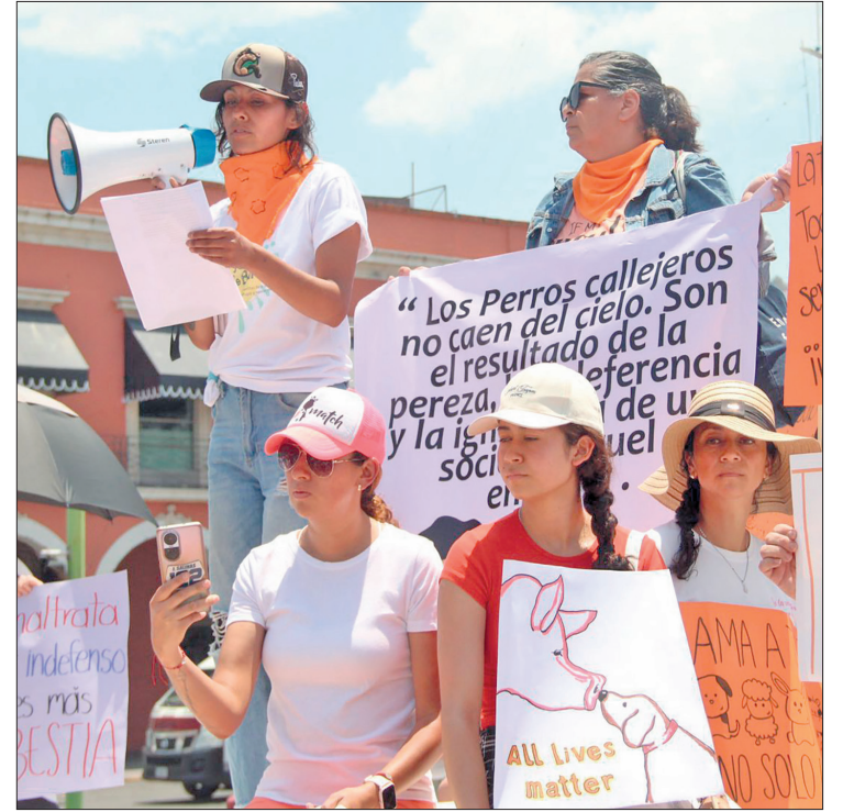
▲ Entre las demandas más fuertes de la marcha de ayer está que un organismo externo pueda evaluar las funciones de la unidad especializada en delitos contra los animales.

En cuanto a la carpeta de investigación que procedió y es del año pasado, fue sobre el asesinato de un perro en Actopan, mientras que las otras dos son de Pachuca, respecto al abandono de un perro en San Cayetano y la de un gato torturado en la misma colonia; las demás denuncias en espera se tratan de animales abandonados y envenenamiento.