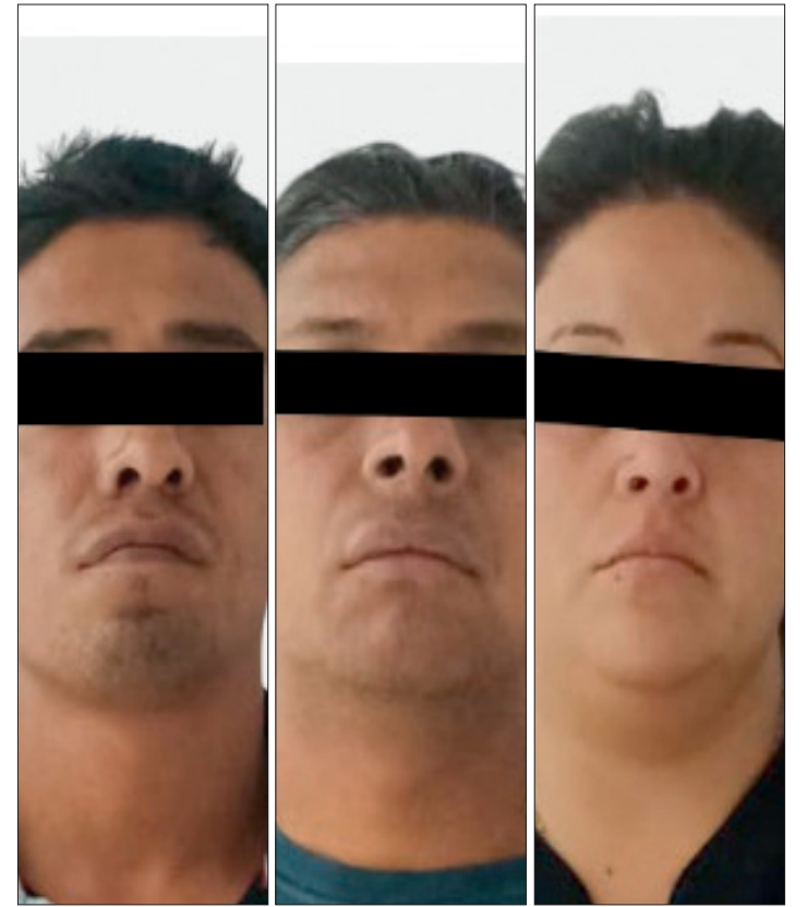
▲ Los sujetos, al notar la presencia de las patrullas, intentaron evadir a la autoridad.

Tanto los detenidos como los objetos asegurados fueron puestos a disposición del agente del Ministerio Público correspondiente, quien determinará su situación jurídica. Mientras tanto, continúan las investigaciones derivadas de los hechos