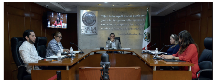
▲ Fue revisado el expediente y avaló su pertenencia al pueblo originario.

Además, se vinculó al instituto electoral para que, en lo subsecuente, en casos similares, de existir duda sobre la adscripción indígena, analice el expediente para evitar mayores dilaciones al respecto.