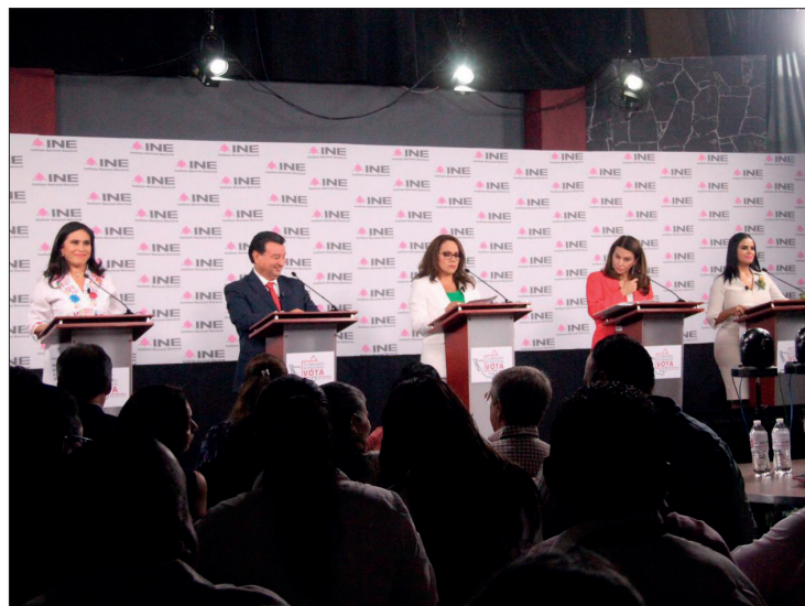
▲ El ejercicio democrático fue dividido en dos bloques donde se debían abordar diversos temas, como educación, medio ambiente, cambio climático y migración.