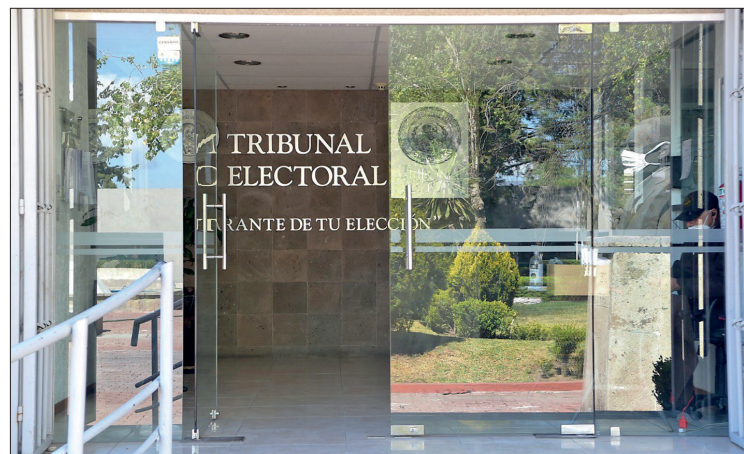
▲ El Tribunal Electoral explicó que será por primera vez y por un periodo de cuatro años.

“En el caso de los organismos empresariales yo les pediría a los dirigentes que nos digan, porque además hay la confianza suficiente, casos concretos, lugares concretos, personas afectadas que las canalicen a que denuncien, vamos a tener todo el cuidado de que no salgan perjudicados, pero además inhibirlos de estas agresiones”.