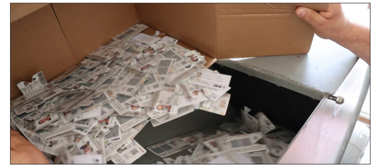
▲ No acudieron a recogerla en un periodo de dos años; personas no aparecerán en el listado nominal.

El encargado de la vocalía del Registro Federal de Electores refirió que, aunque el número de credenciales fue de casi mil, ésta cifra se ha reducido comparada con otros años.