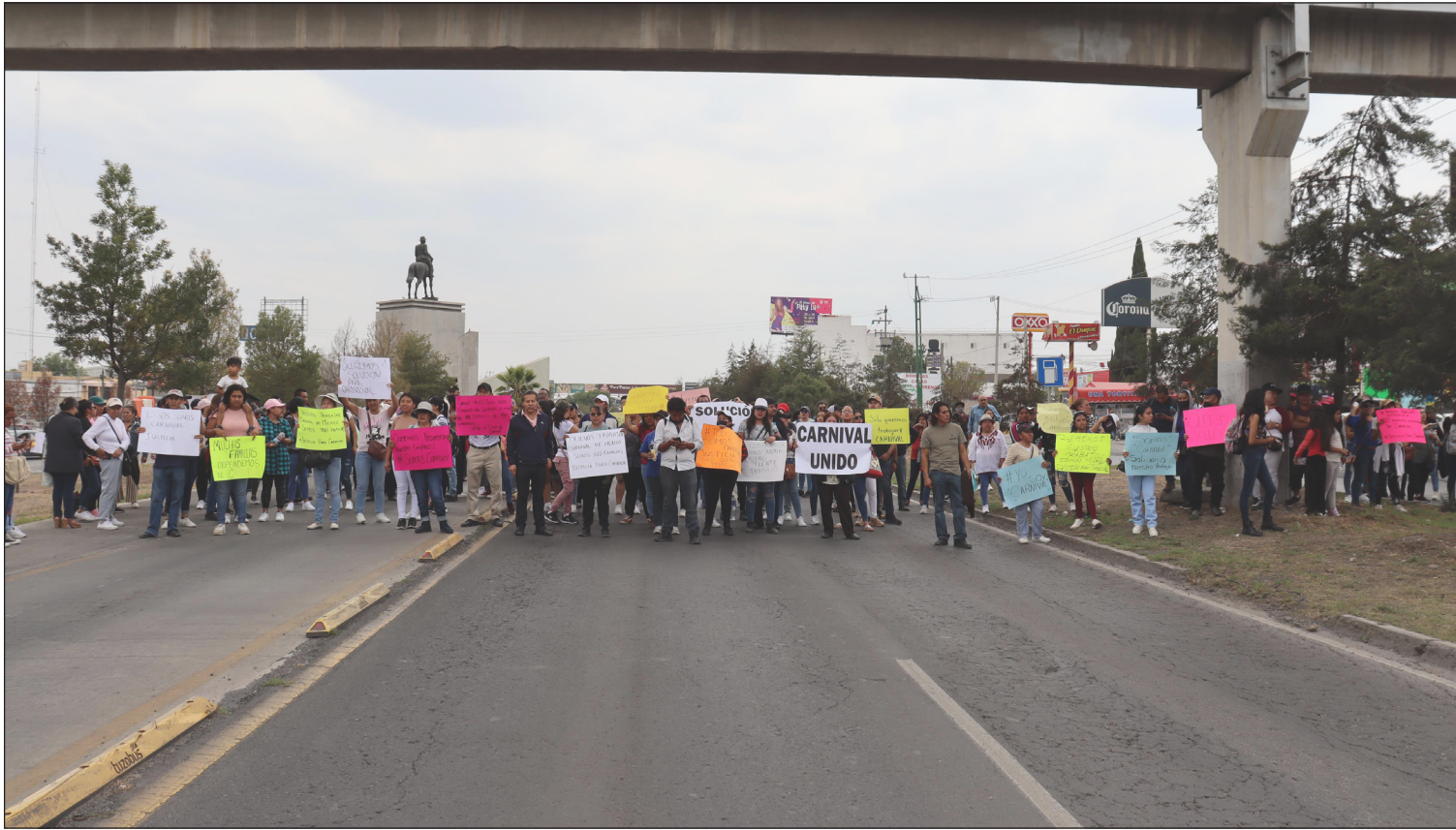
▲ Trabajadores de la empresa Carnival, en su planta de Pachuca, realizaron un bloqueo sobre la carretera México-Pachuca para exigir al Gobierno estatal su intervención ante el cierre de sus instalaciones desde la semana pasada por un conflicto legal. Tras la mediación de la Secretaría de Gobierno, se acordó con los empleados retirar el bloqueo cerca de las dos de la tarde para establecer una comisión y dialogar con las autoridades.

SÁBADO 27 DE ABRIL DE 2024 HIDALGO // AÑO 3 NÚMERO 1051 // Precio 10 pesos