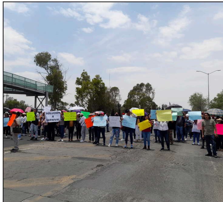
▲ Los quejosos expresaron incertidumbre por sus condiciones laborales, pues no han tenido un acercamiento con las autoridades para conocer el estado procesal de la empresa ni de la plantilla laboral.

No obstante, amenazaron que en caso de no darles una solución, estarían manifestándose nuevamente el próximo lunes.