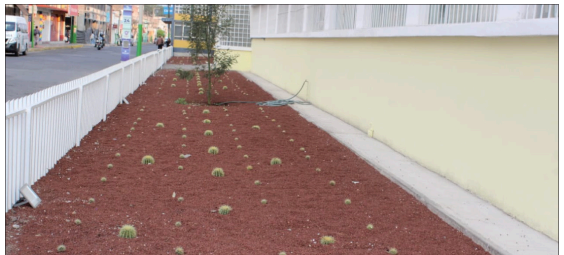
▲ Hace casi dos meses fueron talados varios ejemplares de las jardineras de la secundaria José María Lezama, en el centro de Tulancingo.

En junio de 2022, en la colonia Nuevo Tulancingo, se derribaron 31 árboles de la especie pino, 29 estaban infestados del gusano descortezador. En agosto de 2023, se talaron 30 árboles en la privada San Andrés en la colonia Jaltepec, a causa de la misma plaga.