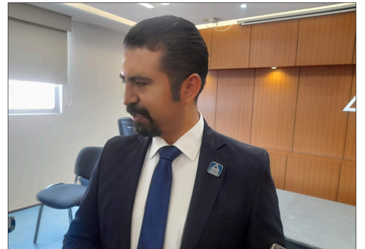
▲ Lamentó que adelantara su negativa a tener un acercamiento con los empresarios del Consejo.

Finalmente reiteró que el CCEH no es partidista y ha dado oportunidad a todas las representaciones políticas de presentar sus propuestas y tener un acercamiento directo, “lo que buscamos es que el sector empresarial y Gobierno trabajen en conjunto”, afirmó.