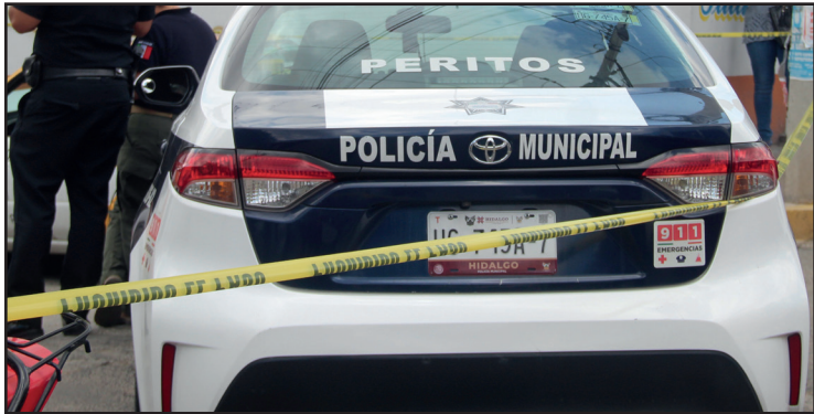
◀ En enero fueron registradas 10 incidencias con arma de fuego; en marzo, 16.

Pasó de 24 registros en enero a 43 en marzo, reveló el Secretariado Ejecutivo del Sistema Nacional de Seguridad Pública