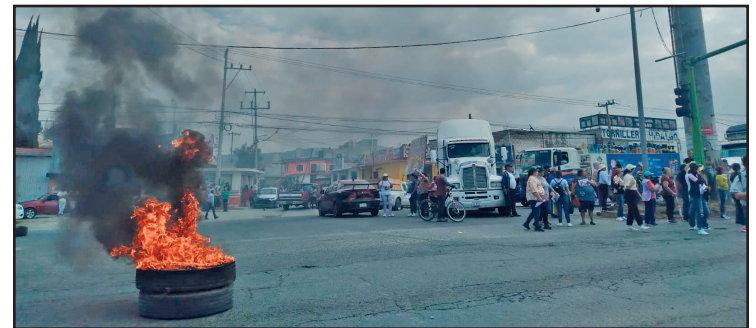
▲ Amigos y vecinos de las víctimas incendiaron llantas como acto de protesta.

Equipos de emergencia acudieron al lugar y trasladaron a la menor y a su