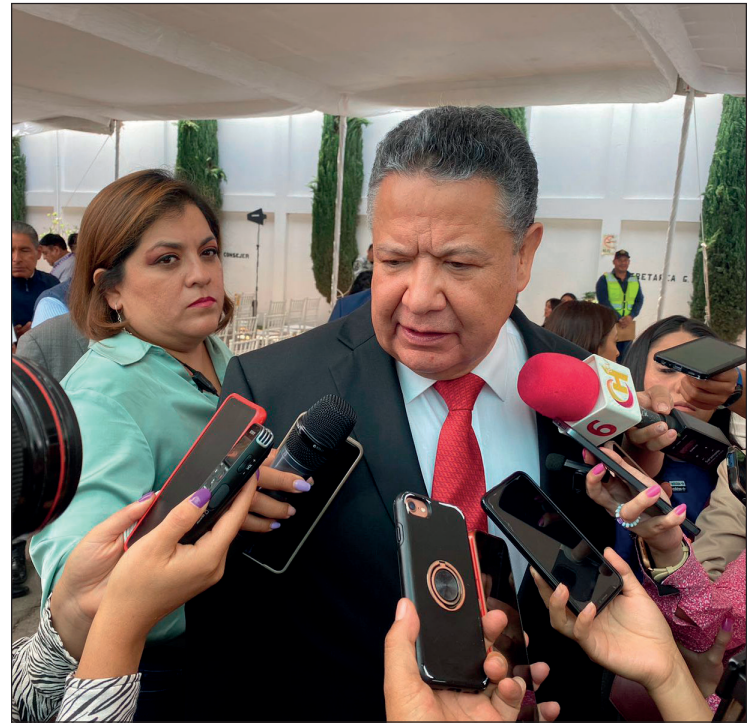
▲ El gobernador destacó que desde el inicio de su administración se hizo un compromiso para luchar contra la corrupción e impunidad, con un intenso ejercicio de la Auditoría Superior del Estado, la Procuraduría General de Justicia del Estado de Hidalgo y la Contraloría.

También mencionó que hasta la fecha hay alrededor de mil hectáreas afectadas por los incendios, especialmente en áreas de difícil acceso, pero destacó que las recientes lluvias han sido un respiro para la zona centro y han contribuido a sofocar los incendios forestales.