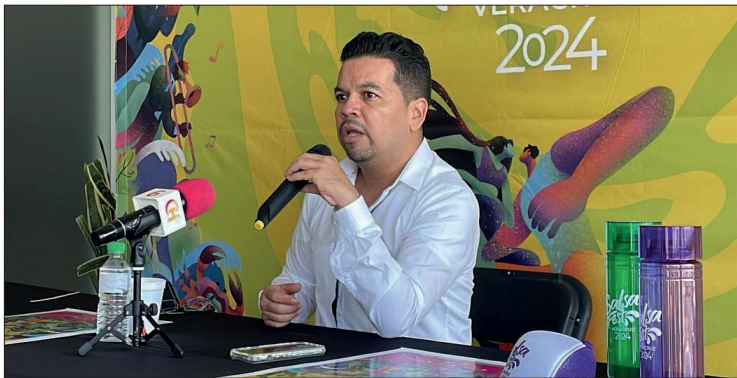
▲ En rueda de prensa informaron que en la edición anterior rompieron récord de asistencia.

Finalmente, invitaron a hacer el registro a través de internet y no dejarse sorprender, ya que esta gran fiesta es gratuita.