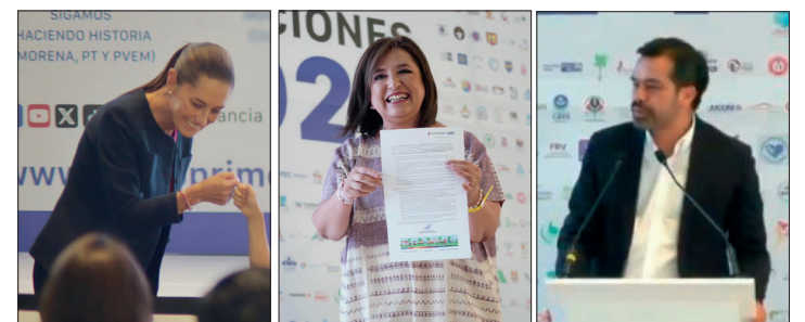
▲ Claudia Sheinbaum se reunió con integrantes del Council of the Americas. Xóchitl Gálvez dialogó con empresarios en el Centro Asturiano de México. Jorge Álvarez Máynez firmó el Pacto por la Primera Infancia.

Tras acudir a la firma del Pacto por la Infancia, Gálvez Ruiz acudió al Centro Asturiano de México,