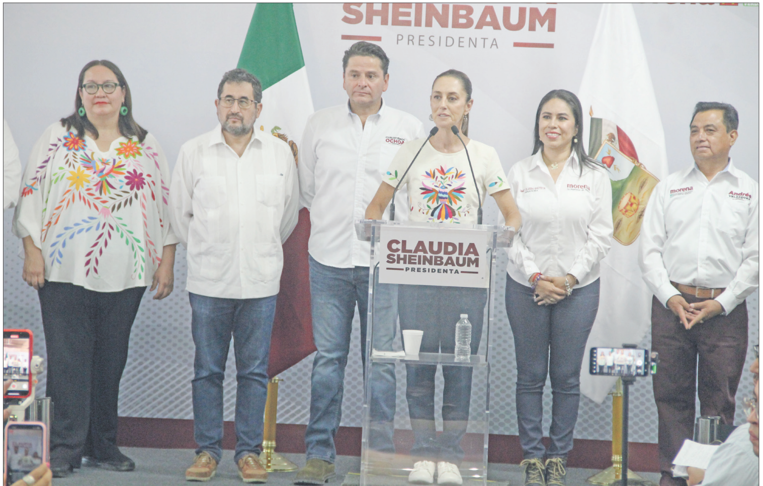
▲ La candidata de la coalición Sigamos Haciendo Historia, Claudia Sheinbaum Pardo, exhortó a privilegiar el proyecto de nación por encima de las diferencias partidistas.