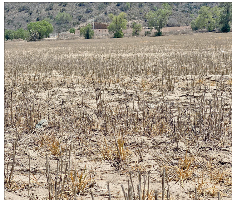
▲ Las altas temperaturas podrían generar efectos negativos sobre las siembras.

Para junio, la temperatura máxima sigue siendo la que más diferencia tiene con respecto a la media; se esperan temperaturas máximas promedio de hasta 35 °C, es decir, 1.3 °C más que lo normal.