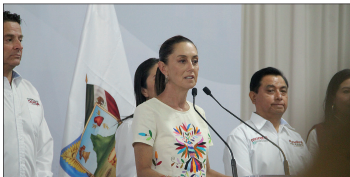
▲ Claudia Sheinbaum aseguró que Arturo Zaldívar continuará en su equipo de campaña a pesar de la investigación en su contra.

Por otra parte, hizo un llamado al Instituto Nacional Electoral (INE) para que haga una campaña respecto a que el 2 de junio es la elección, ya que consideró que a la fecha no se ha difundido el tema, lo que podría generar menor participación del electorado.