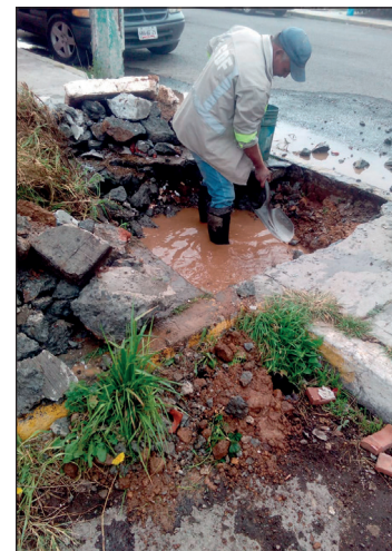
▲ En el primer trimestre de este año se atendieron 457 fugas en diversos sectores.

En enero se registraron 198 fugas, en febrero y marzo hubo 126 y 133, respectivamente. El organismo refirió que en la mayoría de los casos la falla se debe al desgaste de la infraestructura y daños en la tubería.