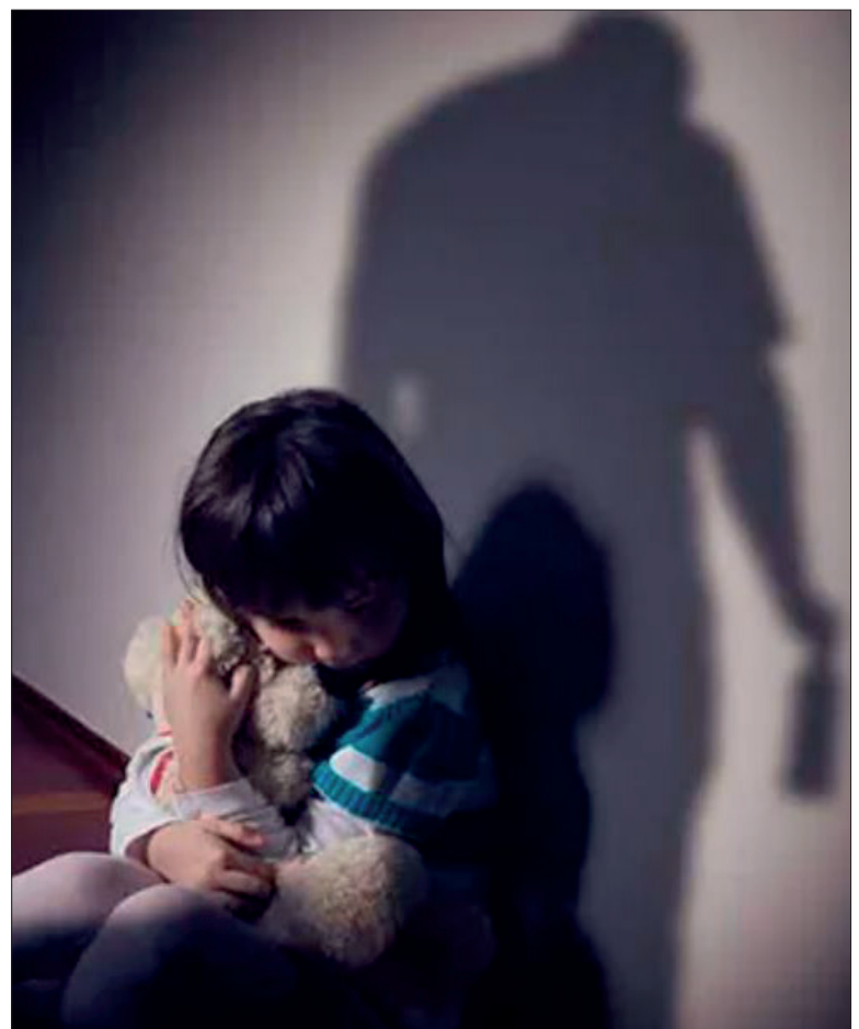
▲ La información fue actualizada esta semana en el marco del Día de la Lucha contra el Maltrato Infantil.