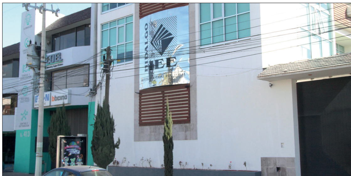
▲ En sesión extraordinaria representantes de partidos reconocieron la celeridad con la que el Instituto realizó las gestiones.

En la reunión, en la que se tuvo la asistencia de representantes de los gobiernos estatal, municipal, sector salud, educativo, CFE, Cruz Roja, Seguridad Pública Municipal y DIF Huejutla, entre otros organismos, se estableció el compromiso de fortalecer las acciones de prevención en zonas consideradas como de alto riesgo, a fin de proteger a la población.