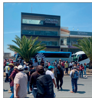
▲ Usuarios del riego 112 Ajacuba se manifestaron en las oficinas de la Comisión Nacional del Agua (Conagua) delegación Hidalgo, para exigir el agua negra en sus cultivos.

Los productores amenazaron con bloquear vialidades en la capital hasta tener respuesta