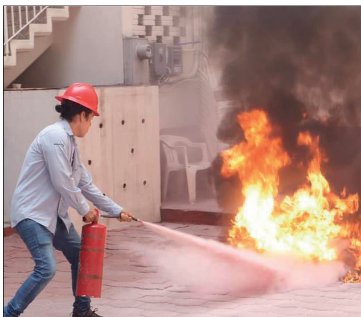
▲ El objetivo de este organismo es coordinar esfuerzos ante los embates que fenómenos meteorológicos pudieran ocasionar.

“Los vigilan todo el tiempo y son seguidos constantemente por camionetas y vehículos que no están reconocidos y eso genera inquietud, porque se sienten acosados”, mencionó la también candidata al Senado de la República.