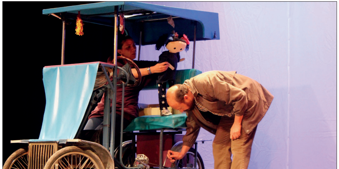
▲ Es una puesta en escena con actores y títeres, así como un coche de parque que se vuelve muy atractivo.

Además, “El niño de lodo” ya cuenta con 110 funciones, pero no pierde su vigencia debido a que ayuda a explicarles a las niñas y a