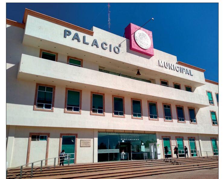
▲ El ayuntamiento informó que son casi 20 atracciones para la celebración a la niñez.

Al momento de ingresar se colocará a cada niño una pulsera que será canjeable por un regalo sorpresa al salir.