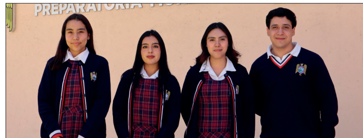
▲ Alumnos de la Preparatoria Morelos participarán en el encuentro Unesmun.